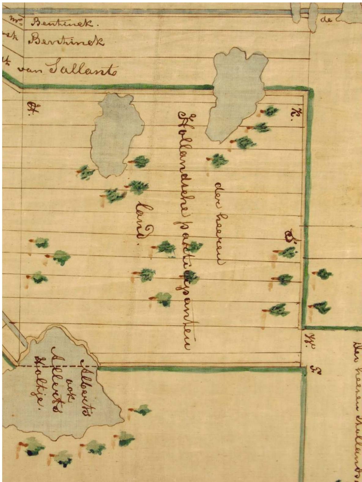
Vierkante Blok, 1637. De blauwe vlakken zijn meertjes. We zien een waterrijk gebied met bomen, wat erop wijst dat er ook sprake was van zandkoppen. Rechtsonder zien we het begin van het Grote Blok, het veengebied rondom het Zuideropgaande, van de Riegshoogtendijk tot Nieuwlande. Ten noorden van het gebied van de Hollanders zien we stroken veen van de familie Bentinck, die we later als het Krakeel leerden kennen.